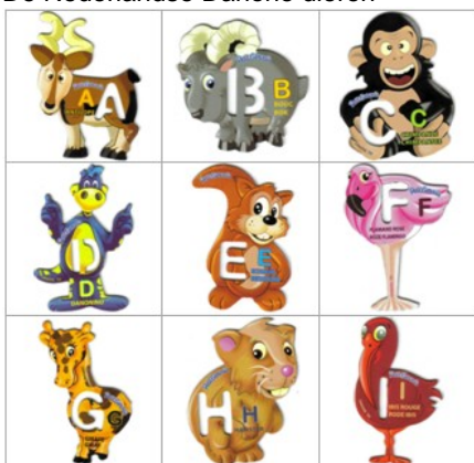
De Belgische Danone dieren.