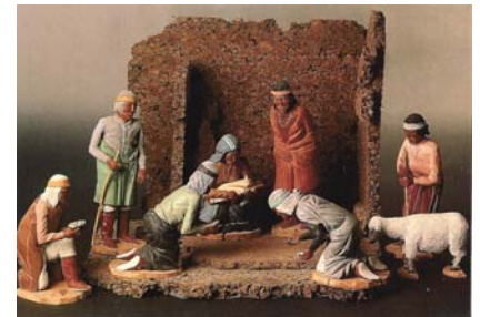
Kerstkaart met figuren van de Navajo indianen.